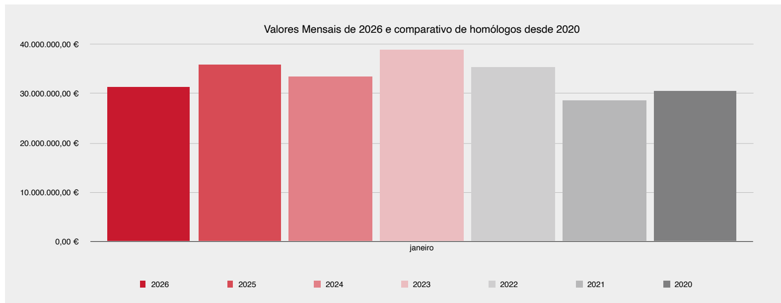
Valores Mensais de 2026 e comparativo de homólogos desde 2020